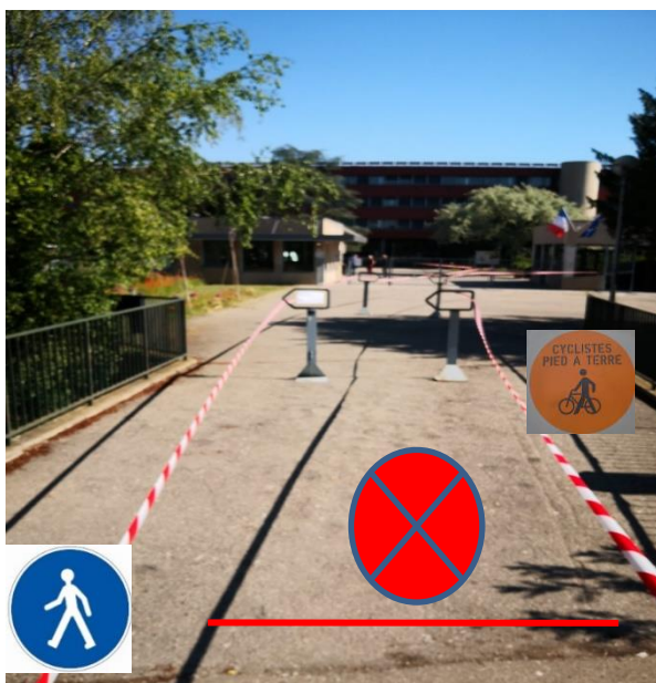
Zone interdite de 2m de large jusqu'au portail de la loge