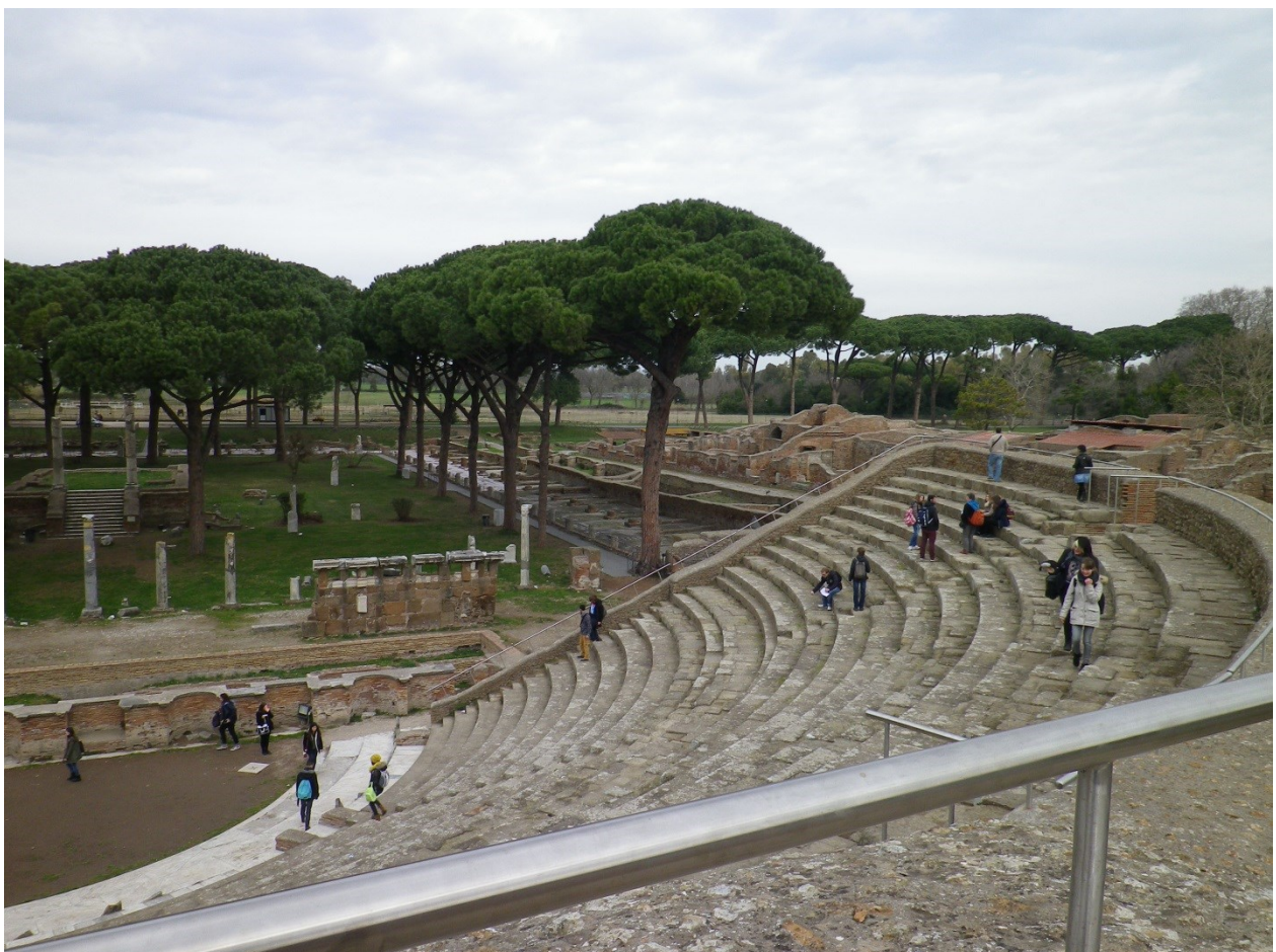
La cavea du théâtre et la place des corporations, entourée des célèbres mosaïques sous les pins parasols