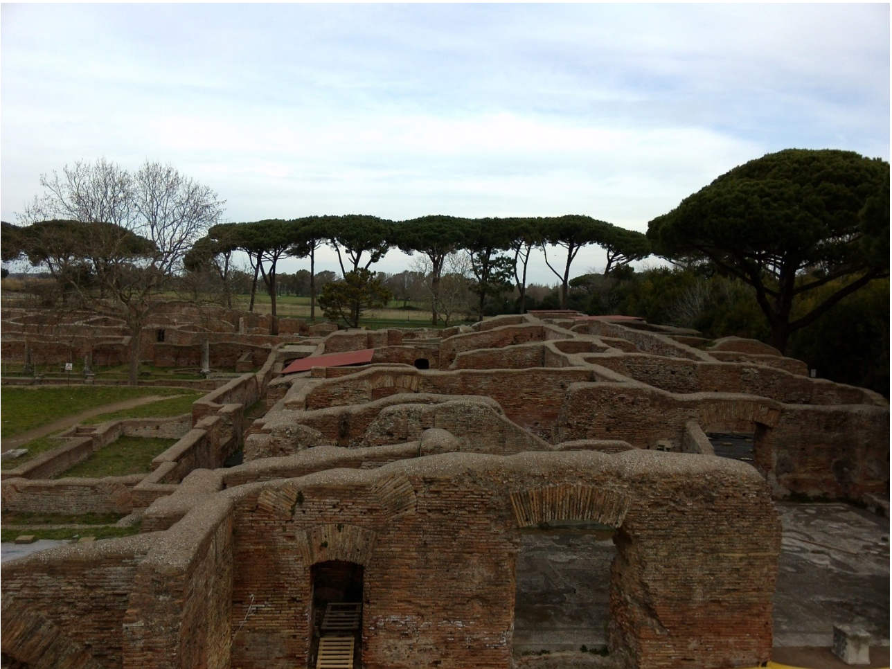
Près de l'entrée du site d'Ostie, le quartier des thermes et de la caserne de vigiles.