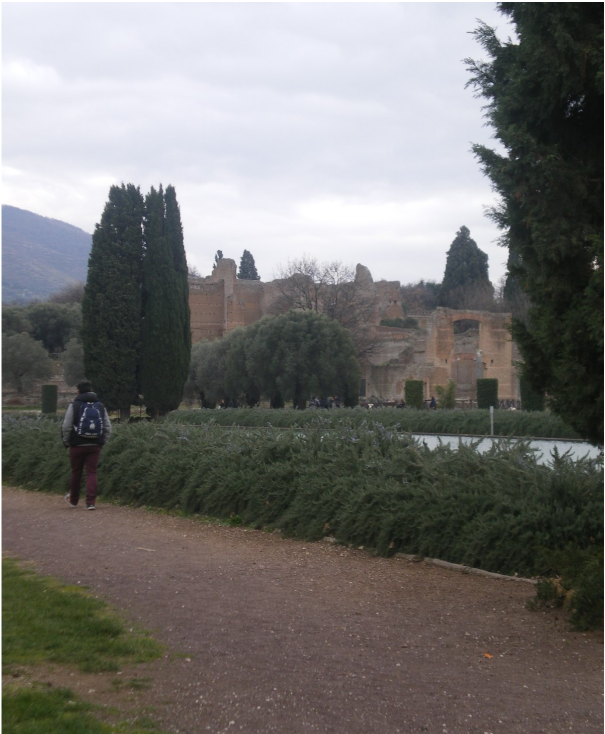
Le bassin était environné d'un portique, ou allée couverte, qu'il fallait parcourir sept fois pour une promenade digestive. Fabrice, notre chauffeur, semble entamer une telle promenade, qui s'impose après le sandwich fourni par l'hôtelier !