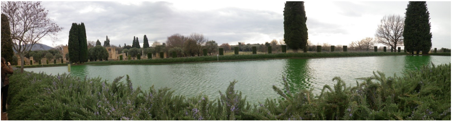
Le pœcile, bassin que l'on découvre à l'entrée du site de la villa Hadriana. (II ème siècle ap. JC)