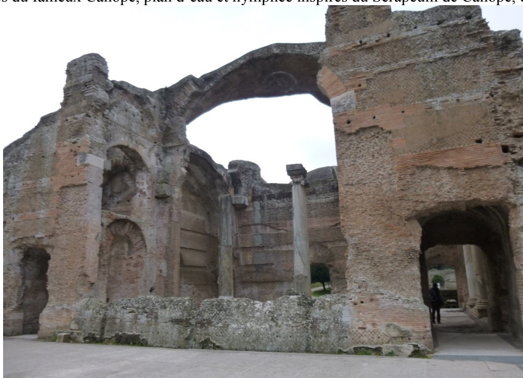
Vue sur les coupoles impressionnantes des thermes, attestant des expériences menées par l'empereur Hadrien, passionné d'architecture.