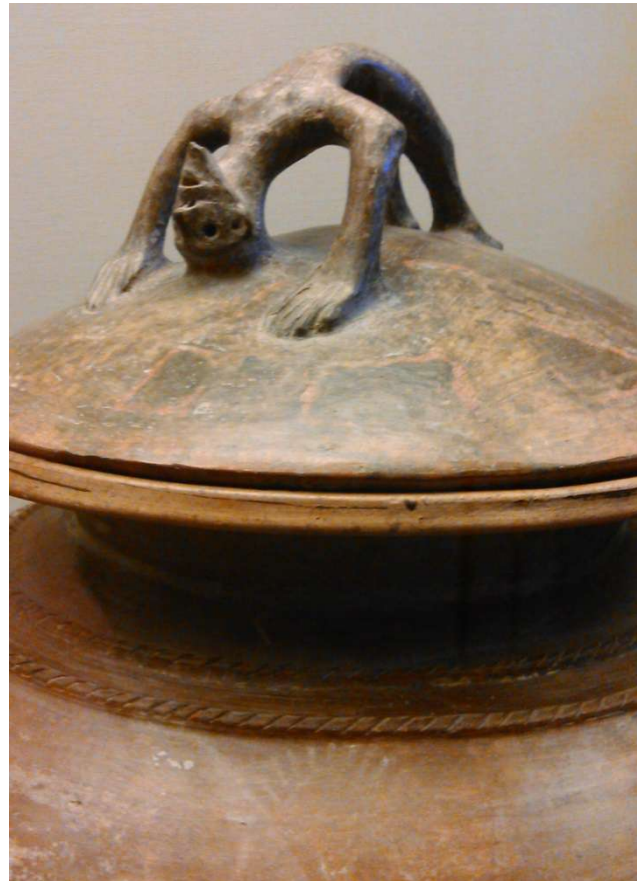
Une anse sur le couvercle d'une urne funéraire : très originale, la position qui a inspiré certaine élève