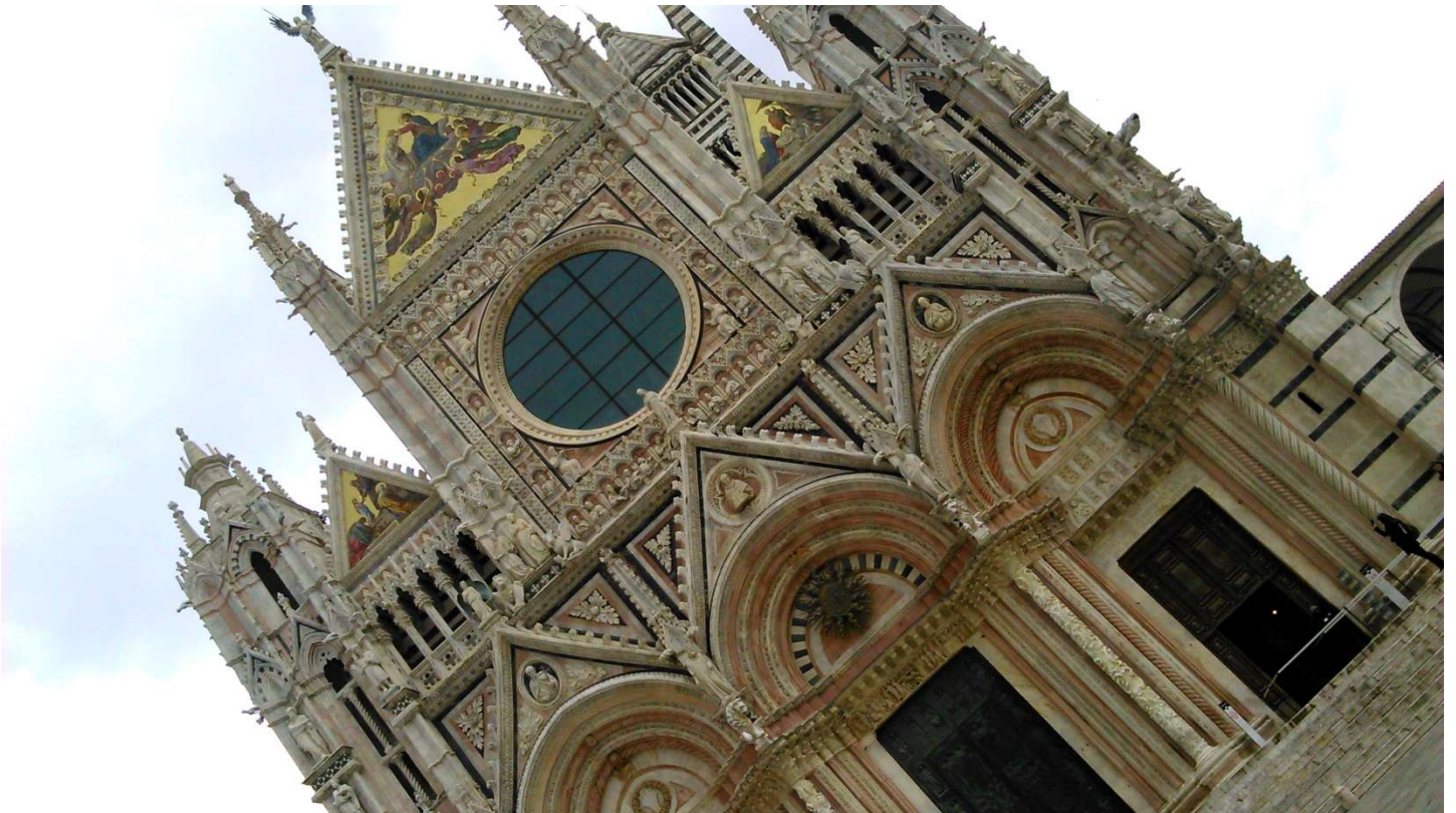
Non, ce n'est pas la tour de Pise, c'est bien la façade du Duomo de Sienna. C'est le photographe qui avait un 'penchant' !!