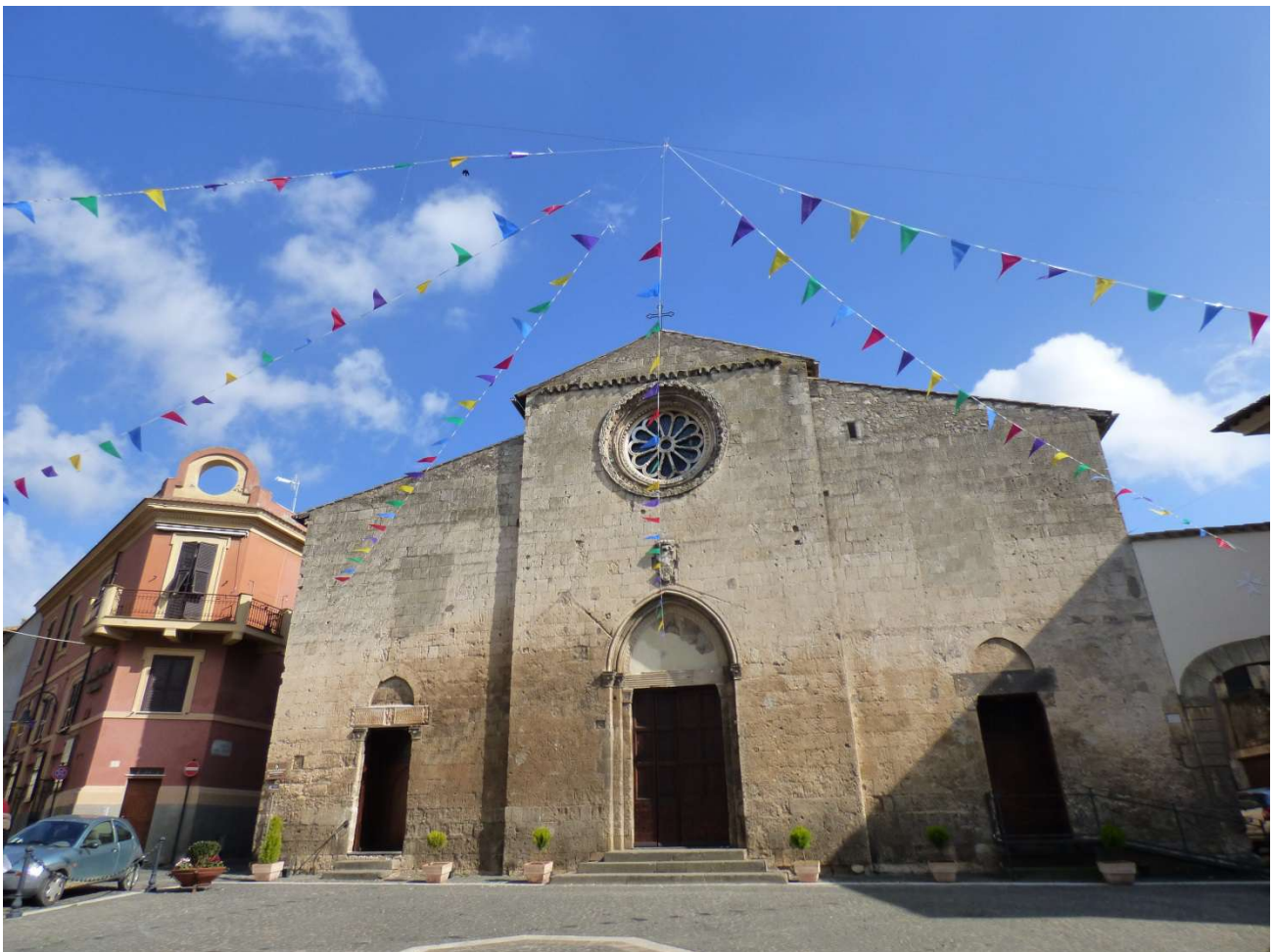
Au lendemain des fêtes du carnaval, les fanions égayent encore la place de l'église.