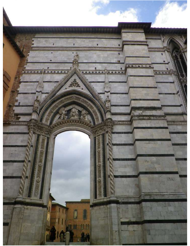
La façade du nouveau Duomo, gigantesque et jamais achevée offre un portail à ciel ouvert.