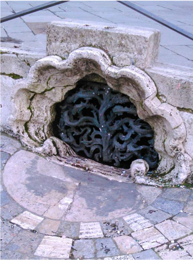
Au bas de l'éventail de la Piazza del Campo à Sienna, une grille filtre les eaux de pluie.