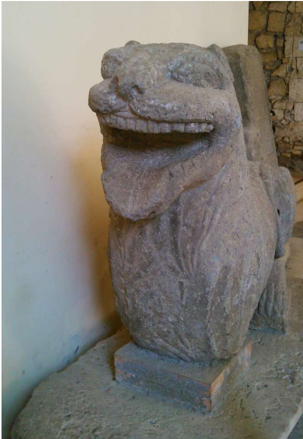
Griffon souriant ?? monstre protecteur ?