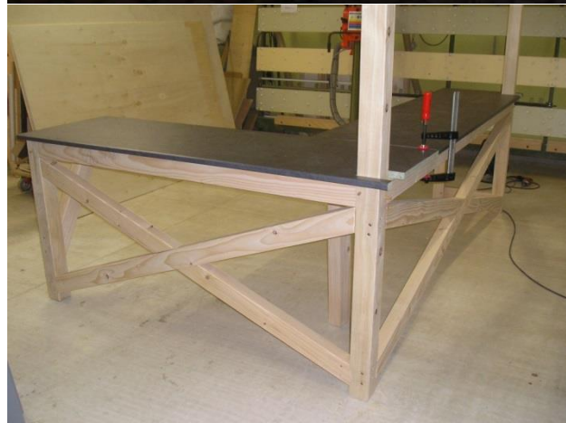
Réalisation d'un stand pour le marché de Noël de Riquewihr