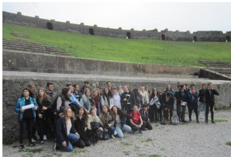
Dans l'amphithéâtre de Pompéi, février 2018